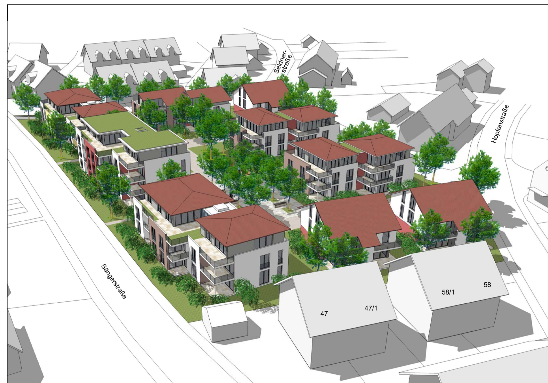
Perspektive (Blickrichtung Nordost)