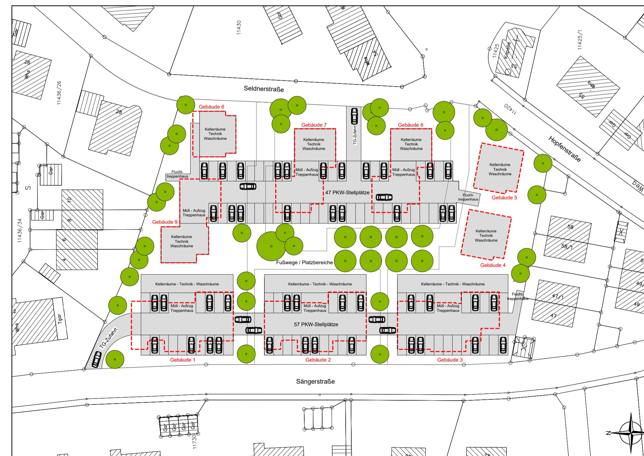
Vorentwurf Tiefgaragen- und Kellergeschoss unter Berücksichtigung der vorgesehenen Baumpflanzungen